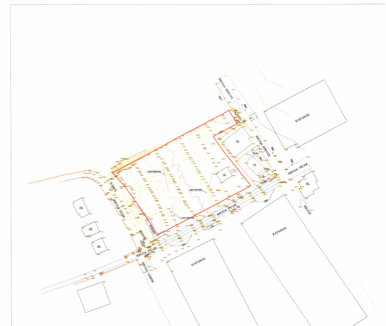
HARTA TOPOGRAFIKE SHK. 1:2000